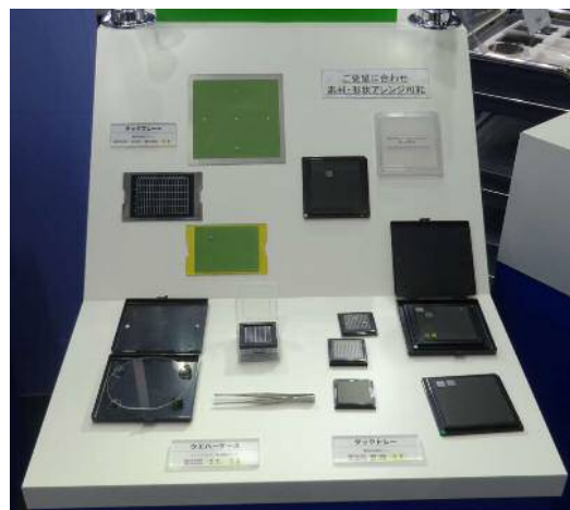
↑ ○タックトレイ、タックプレート