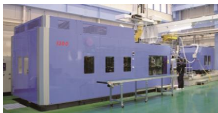
スーパーエンブラ対応大型成形機