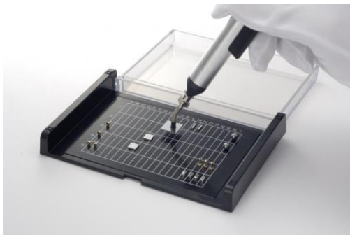
タックキャリア (搬送ケースに最適)