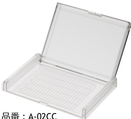
品番 : A-02CC