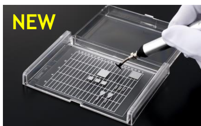
透明タックキャリア (粘着シート付きケース)